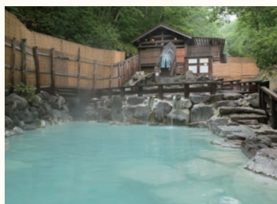
蔵王温泉大露天風呂