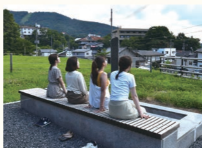
おおみや旅館足湯