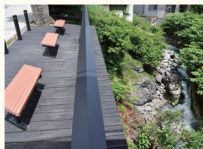
高湯通り酔川どんどんびき見晴台