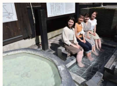
下湯共同浴場足湯